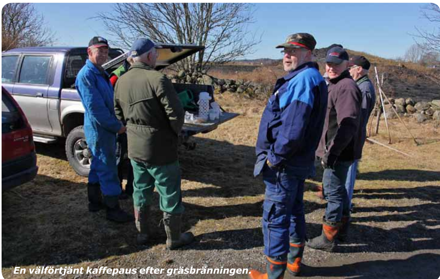
En välförtjänt kaffepaus efter gräsbränningen.